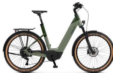
Vitality Eco 10 Cross ..... 22 Shimano Deore XT 11-Gang Linkglide / Bosch Performance Line CX / 750Wh / Disc