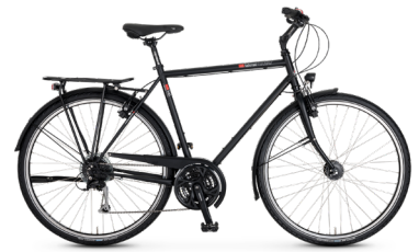
T-100 Kette ..... 66 Shimano Cues 18-Gang / HS11