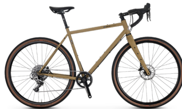
GX-700 ..... 71 Sram Apex XPLR AXS 12-Gang / Disc