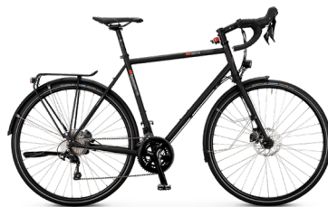
T-Randonneur Light ..... 68 Shimano 105 22-Gang / Disc