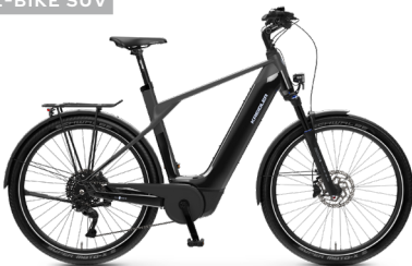
Vitality Eco 10 Sport ..... 21 Shimano Deore 10-Gang Linkglide / Bosch Performance Line CX / 625Wh / Disc