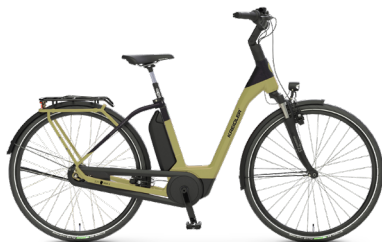
Vitality Eco 3 Comfort ..... 37 Shimano Nexus 7-Gang Rücktritt / Bosch Active Line Plus / 400Wh / HSII