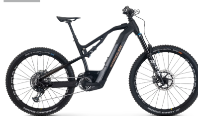
SWYPE 4.0 FS ..... 38 Sram XO 12-Gang / Bosch Performance Line CX / 750Wh