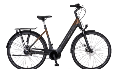
Vitality Eco 8 ..... 29 Shimano Nexus 5-Gang Rücktritt / Bosch Performance Line / 625Wh / Disc