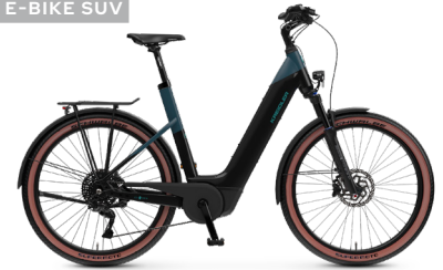
Vitality Eco 10 Sport ..... 20 Shimano Deore XT 11-Gang Linkglide / Bosch Performance Line CX / 750Wh / Disc