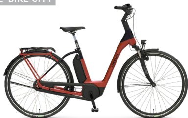
Vitality Eco 3 Comfort ..... 36 Shimano Nexus 7-Gang Freilauf / Bosch Active Line Plus / 400Wh / HSII