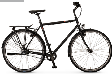
T-300 ..... 64 Shimano Alfine 8-Gang Freilauf / HS22 / Gates