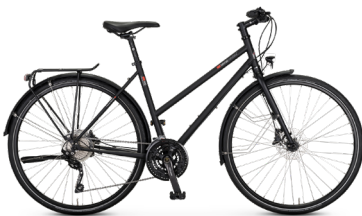
T-500 ..... 61 Shimano Cues 20-Gang / Disc