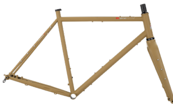
GX-700, Rahmen-Set ..... 75 Rahmen-Set inkl. Gabel, Steuersatz, Anbauteilen