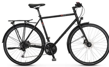
T-100 Sport ..... 65 Shimano Cues 18-Gang / Disc