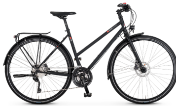
T-700 ..... 59 Shimano Cues 22-Gang / Disc