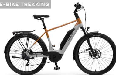
Vitality Eco 3 Sport ..... 35 Shimano Cues 9-Gang / Bosch Performance Line / 545Wh / Disc