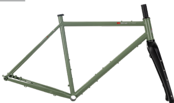
GX-900, Rahmen-Set ..... 74 Rahmen-Set inkl. Carbon-Gabel, Steuersatz, Anbauteilen