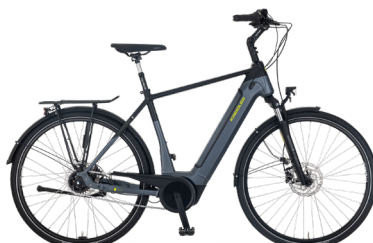
Vitality Eco 8 ..... 28 Shimano Nexus 5-Gang Freilauf / Bosch Performance Line / 625Wh / Disc