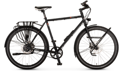
TX-1000 ..... 53 Rohloff Speedhub 14-Gang / Disc / Gates