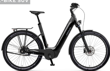
Vitality Eco 10 ..... 24 Shimano Nexus 5-Gang Freilauf / Bosch Performance Line CX / 625Wh / Disc / Gates