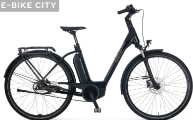
Vitality Eco 6 Comfort ..... 33 Shimano Nexus 5-Gang Freilauf / Bosch Performance Line CX / 545Wh / Gates