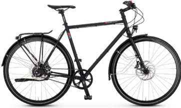
T-900 ..... 58 Rohloff Speedhub 14-Gang / Disc / Gates