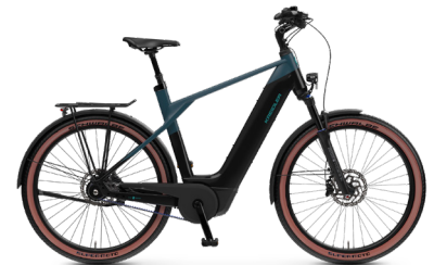
Vitality Eco 10 ..... 23 Shimano Nexus 5-Gang Freilauf / Bosch Performance Line CX / 750Wh / Disc / Gates