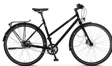
T-500 ..... 62 Shimano Alfine 8-Gang Freilauf / Disc