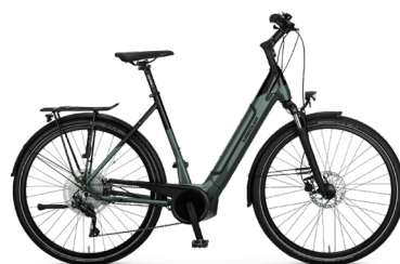
Vitality Eco 7 Sport CX ..... 31 Shimano Cues 10-Gang / Bosch Performance Line CX / 625Wh / Disc