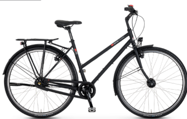
T-100 ..... 67 Shimano Nexus 8-Gang Freilauf / HS11