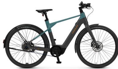
Vitality E Urban ..... 19 Shimano Nexus 5-Gang Freilauf / Bosch Performance Line SX / 400Wh / Disc / Gates