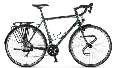
TX-Randonneur ..... 56 Shimano 105 22-Gang / V-Brake