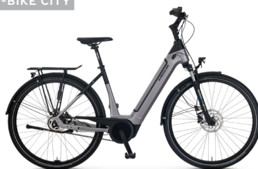
Vitality Eco 8+ ..... 25 Shimano Nexus 5-Gang Rücktritt / Bosch Performance Line / 625Wh / Disc / Gates