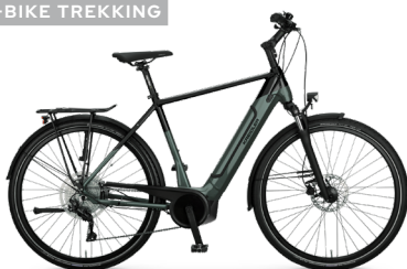
Vitality Eco 7 Sport CX+ ..... 30 Shimano Deore 10-Gang Linkglide / Bosch Performance Line CX / 625Wh / Disc