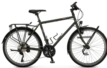
TX-400 ..... 55 Shimano Cues 22-Gang / HS33