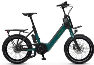
Vitality Eco Compact 2.0 ..... 17 Shimano Nexus 5-Gang Freilauf / Bosch Performance Line / 625Wh / Disc / Gates