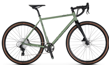
GX-900 ..... 70 Campagnolo Ekar 13-Gang / Disc