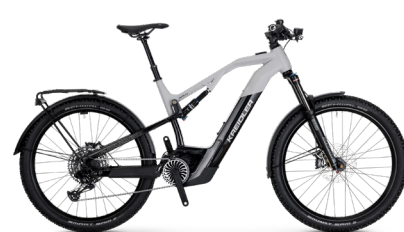
SWYPE 2.0 FS Equipped ..... 41 Sram SX 12-Gang / Bosch Performance Line CX / 625Wh