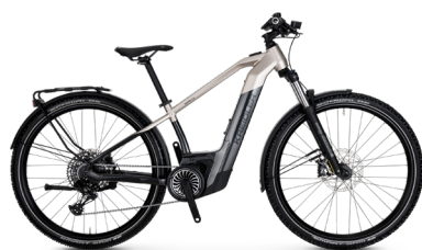
SWYPE 2.0 HT Equipped ..... 42 Sram SX 12-Gang / Bosch Performance Line CX / 625Wh