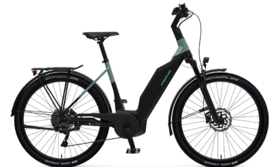
Vitality Eco 6 Cross ..... 32 Shimano Deore 10-Gang Linkglide / Bosch Performance Line CX / 545Wh / Disc