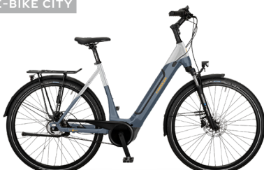
Vitality Eco 8 EDT ..... 27 Shimano Nexus 5-Gang Rücktritt / Bosch Performance Line / 625Wh / Disc / Gates