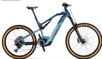
SWYPE 3.0 FS ..... 39 Sram GX 12-Gang / Bosch Performance Line CX / 750Wh