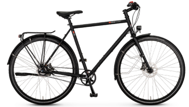
T-700 ..... 60 Shimano Alfine 11-Gang Freilauf / Disc / Gates