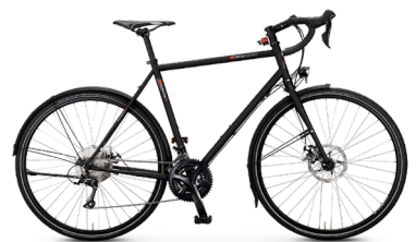
T-Randonneur Sport ..... 69 Shimano Sora 18-Gang / Disc