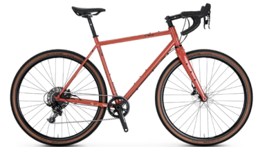
GX-500 ..... 72 Sram Apex XPLR 12-Gang / Disc