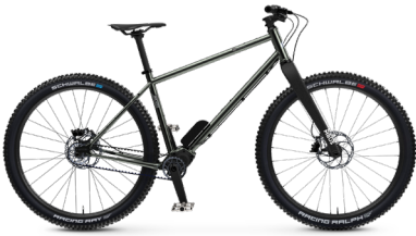
AX-1200 ..... 51 Pinion Smart Shift 12-Gang / Disc / Gates