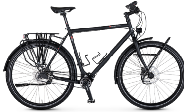
TX-1200 ..... 52 Pinion 18-Gang / Disc / Gates