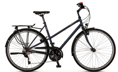
T-300 ..... 63 Shimano Cues 20-Gang / HS22