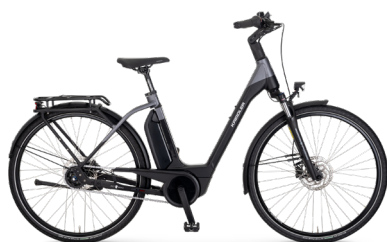
Vitality Eco 6 Comfort ..... 34 Shimano Nexus 5-Gang Rücktritt / Bosch Performance Line / 545Wh / Gates