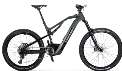
SWYPE 2.0 FS ..... 40 Sram SX 12-Gang / Bosch Performance Line CX / 625Wh