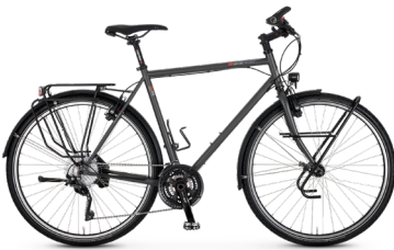
TX-800 ..... 54 Shimano Cues 22-Gang / Disc