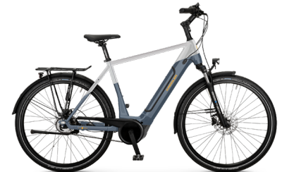
Vitality Eco 8 EDT ..... 26 Shimano Nexus 5-Gang Freilauf / Bosch Performance Line / 625Wh / Disc / Gates